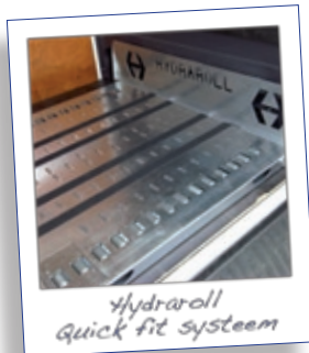
Hydraroll Quick fit systeem