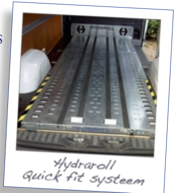
Hydraroll Quick fit systeem

(zie technische informatie en prijslijst op de achterzijde).