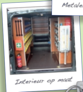
Interieur op maat