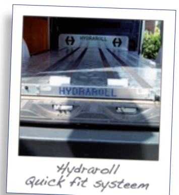
Hydraroll Quick fit systeem